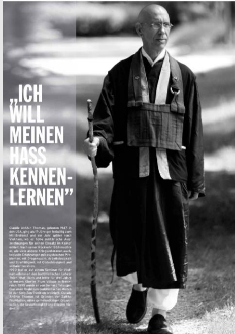
Magazin „Tibet und Buddhismus“, No. 106 / 3 / 2013 / XXVII Jahrgang / S. 14-18 (deutsch) Download PDF (150 KB)